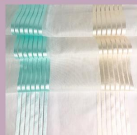
8TK742 Органза жаккард -365 р./м.п